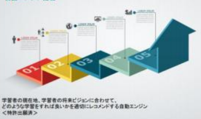
ビッグデータ解析とテスト工学を応用した自動エンジン搭載

従来Eラーニングは、教育担当者が「何を」「誰に」「どの程度」を設計し、教材を作成し、運用するという手間がありました。BIZSTEPは、最新のビッグデータ解析技術とテスト工学により、「何を」「誰に」「どの程度」を自動で提供するサービスです。