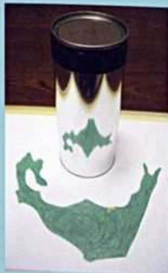
「ひずみ絵変換シート」