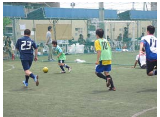
[ フットサル大会 ]

社内コミュニケーションの活性化を目的に、スポーツ大会(ソフトボール大会、フットサル大会等)、ビール祭りを各事業所にて開催しています。