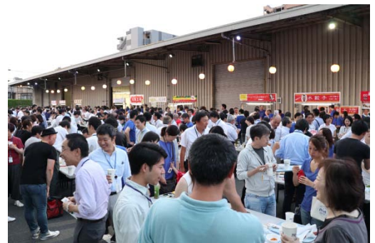
[ 本社ビール祭り ]

インフルエンザ感染拡大を予防するため、流行時期に入る前に各事業所にて予防接種を実施しています。