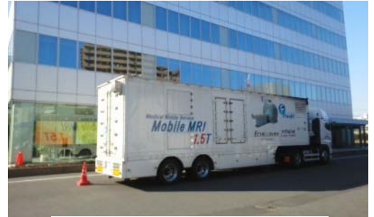
[ MRI脳ドック検診 ]