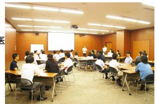
〔 メンタルヘルス教育風景 〕

労働安全衛生法に基づく長時間労働者に対する産業医面談を実施することにより、個人の健康状況を把握し、その結果に基づいた事後措置を講じ、脳・心臓疾患の発症や生活習慣病等を予防しています。