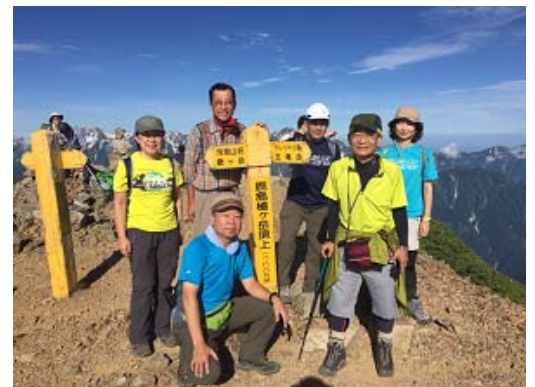
[ ハイキング部(鹿島槍ヶ岳山頂にて) ]

従業員が心身ともに健康になれるようスポーツや趣味に関連した様々なクラブ活動(野球、サッカー、ハイキング、華道等)ができるようになっています。